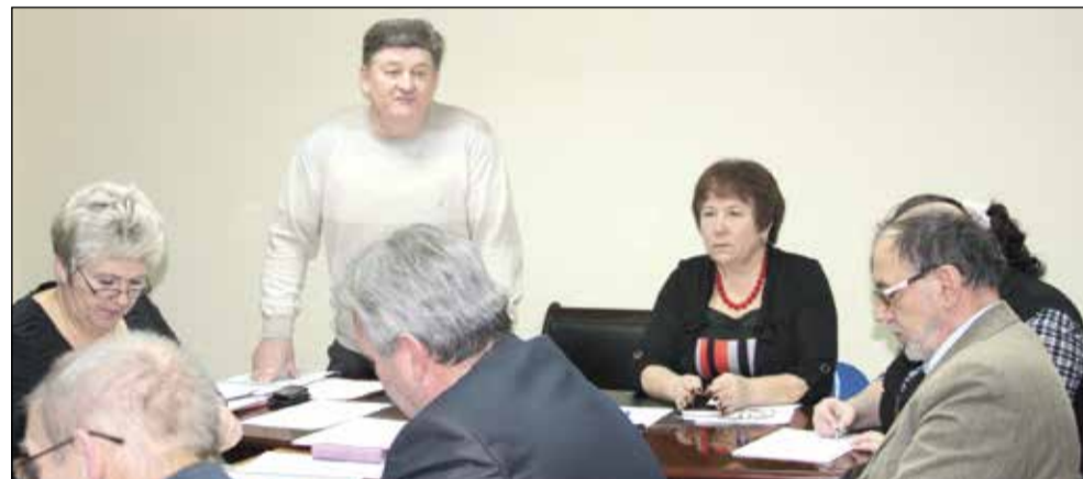
Первое в году заседание