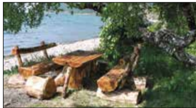
Лучшая пикниковая стоянка

— Много мы делаем для того, чтобы сохранить нашу природу. Ранней весной проводим профилактические мероприятия по отжигу леса. И обязательно встречаем зверей, да каких — мощных, красивых изюбрей, косуль и других. Постоянно патру-